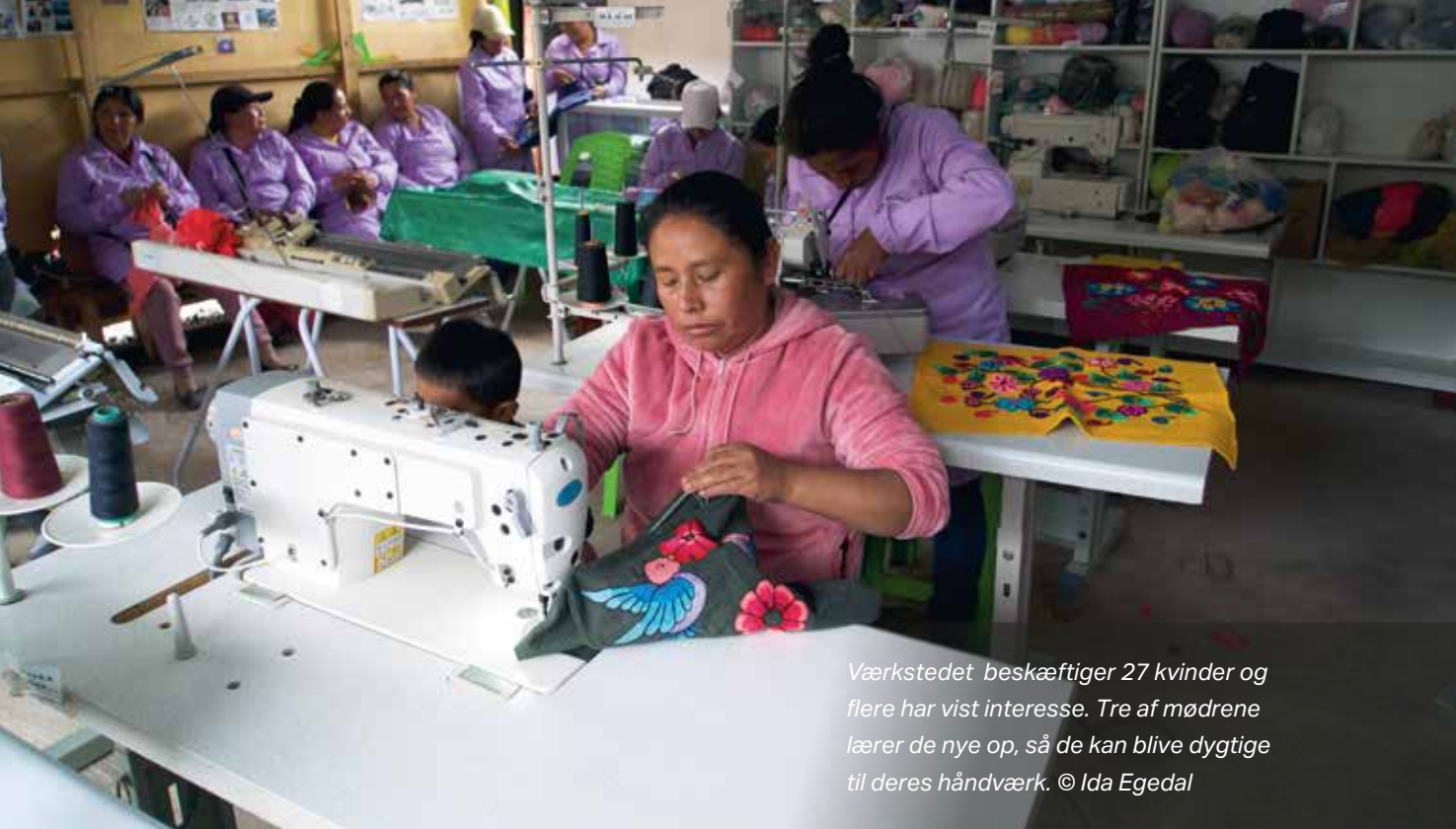
Værkstedet beskæftiger 27 kvinder og flere har vist interesse. Tre af mødrene lærer de nye op, så de kan blive dygtige til deres håndværk.