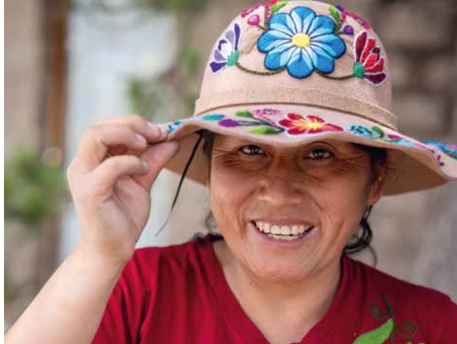
Reyna er én af grundlæggerne af håndarbejdsværkstedet, som ligger på hendes grund. Værkstedet beskæftiger 27 kvinder med at strikke, brodere og væve. En del af kvinderne er enlige mødre og enker, og enkelte er teenagere.

SOS Børnebyerne har arbejdet tæt sammen med mødrene i kvarteret siden 2018. Her har de hjulpet og hjælper stadig kvinderne med at yde støtte og rådgivning i forældreskab, økonomistyring og håndtering af udfordringer i familien. Tidligere var man-