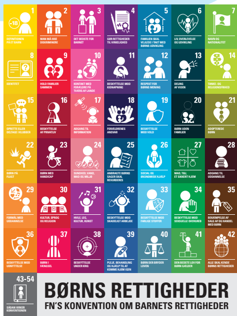
Kilde: Plakaten er lavet af Unicef