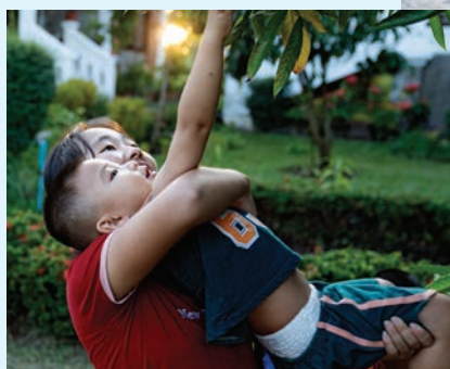
Nogle gange har man brug for lidt hjælp fra sin SOS-mor til at nå.