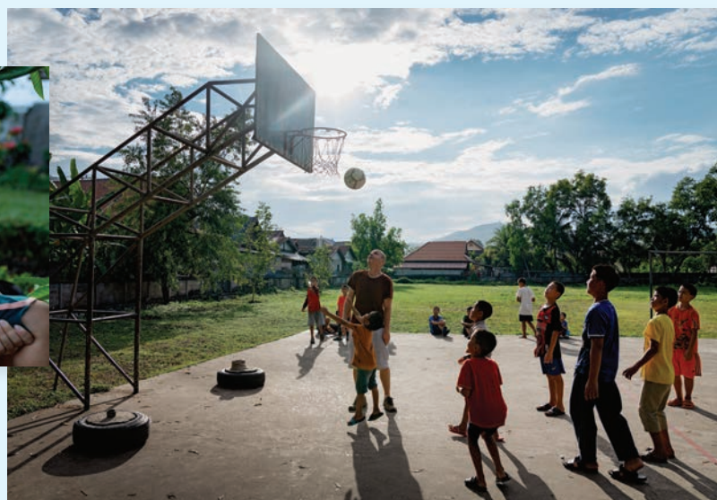
Og der blev også lige tid til basket.