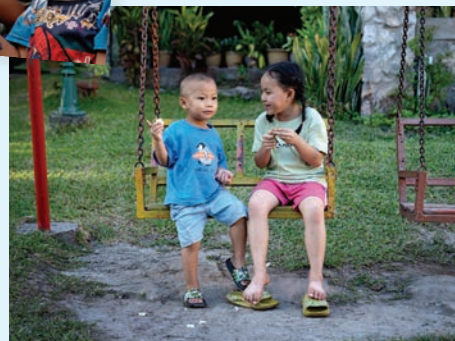
Tid til en svingtur på gyngen med en god ven.