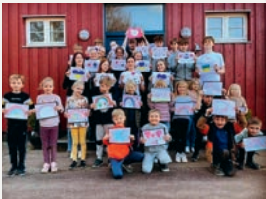
Hald Ege Friskole