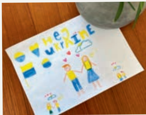
Cecilie, 8 år